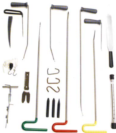
Sistem G Mini, 8 orodij s priborom kat. št. 399