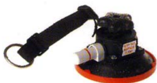
Vakuumsko držalo za orodje, kat. št. 13998