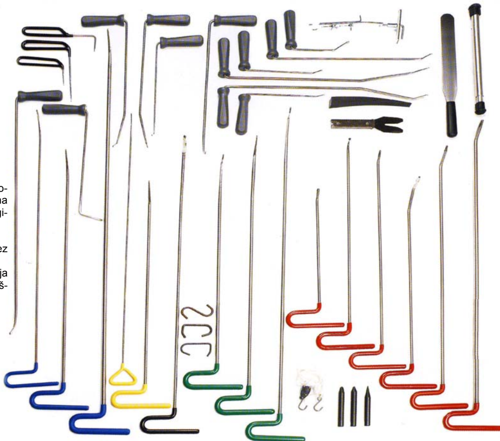
Sistem G Premium, 30 orodij s priborom, kat. št. 400