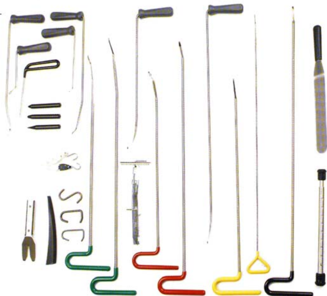
Sistem G Basic, 8 orodij s priborom kat. št. 399