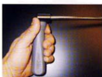
Orodje za ravnanje, kat. št. 13990

Sistem „dvigni in klikni“ omogoča takojšnjo spremembo kota