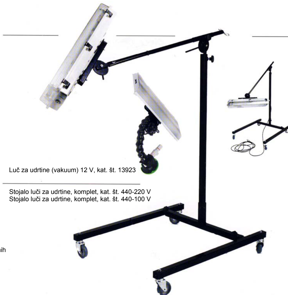
Luč za udrtine (vakuum) 12 V, kat. št. 13923